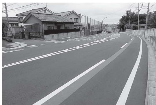
都市計画道路「園生町柏井町線」

伺い、花見川沿川の魅力ある地域資源の活用のため、まずは上流の花見川団地・花島公園エリアの先行的な取り組みを進めること、八千代市エリア・佐倉市エリアとの連携についても徐々に進めていること等のご答弁をいただきました。 「2. 花見川区の諸問題について(2)柏井町、横戸町の道路整備について」では、柏井小学校前交差点から八千代市境までの整備のスケジュールについて伺い、地域から整備の要望が多い「市道横戸町78号線」についての早期の整備をお願いいたします。