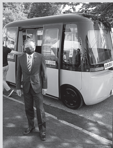
自動運転バス乗車・実証実験