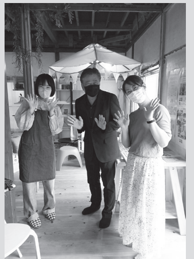
テラコヤココカラ・プレ見学会