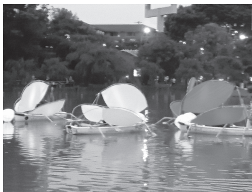
綿内池でのパフォーマンス

このところ約2年半は、新型コロナウイルス感染症の影響により、様々なイベントが中止や延期となっていました。この「夜ハス」には多くの皆様に参加され楽しんでおり、このようなナイトイベントが多くの方々に求められていたことを実感いたしました。